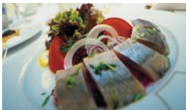
— IL RISTORANTE —

Prezzi: da 130 euro 34, Bolshaya Morskaya ☎ 007-812-3146622 - www.casaletto.it